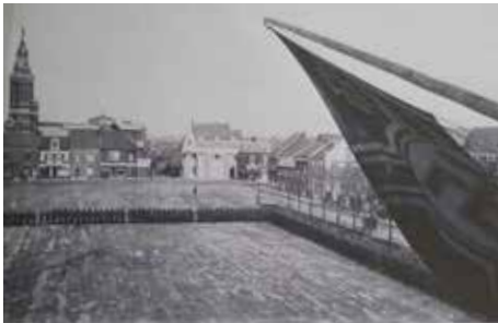
↳ L'Hôtel de Ville pris par l'armée allemande, les soldats se tiennent en ligne sur la place. Vue depuis le balcon de la mairie où un drapeau nazi est installé, 1940.

Durant l'occupation, la salle du Conseil Municipal de l'Hôtel de Ville s'est transformée en prison temporaire et le bureau du Maire est devenu un bureau de la Feldgendarmarie, la police militaire allemande. Les soldats allemands ont réquisitionné des bâtiments, les restaurants et le cinéma.