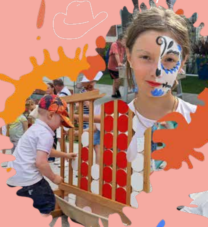
Jeux en libre accès