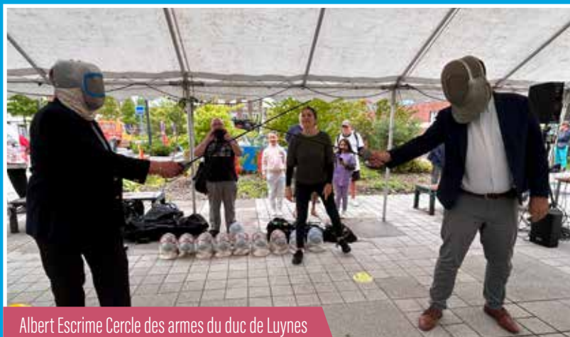
Albert Escrime Cercle des armes du duc de Luynes

Bravo aux services des sports, culturel, enseignement et techniques de la mairie pour l'organisation de ces animations !