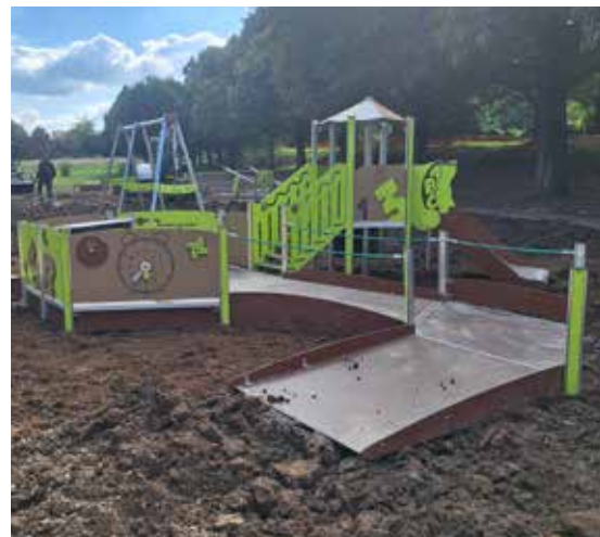
↳ Livraison des premiers jeux, ici la structure multi-activités dédiée au 0-6 ans

Le cheminement piéton le long du camping du côté de l'ancien terrain de golf et celui situé le long du stade resteront