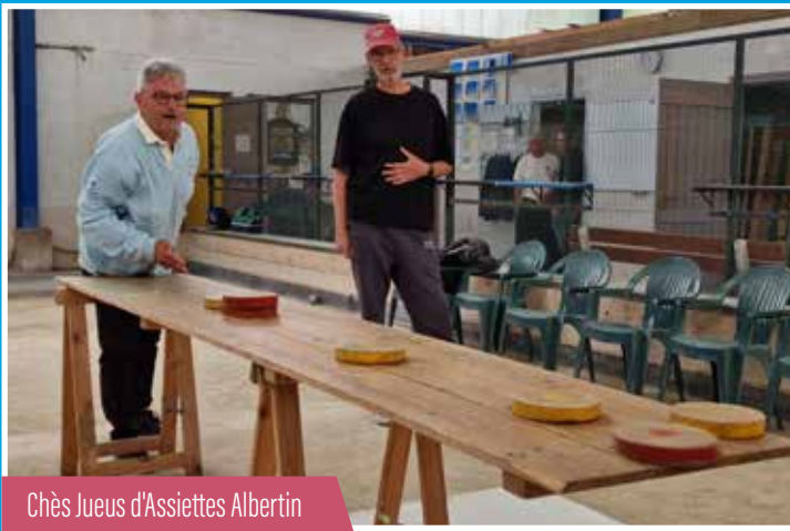
Chès Jueus d'Assiettes Albertin