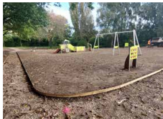
↳ La zone pour les tout petits se définit

L'ouverture est prévue au Printemps, afin de laisser à l'herbe le temps de pousser !