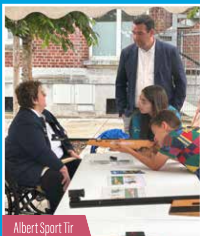
Albert Sport Tir