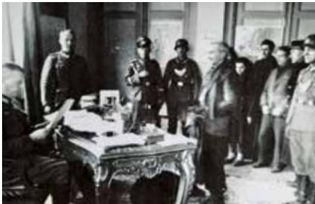
↳ Photo de propagande représentant une arrestation pour marché noir par la felgendarmarie dans le bureau du maire d'Albert, 1941.

De nombreux soldats et résistants ont été emprisonnés à Albert durant cette période, dans des frontstalag (camps de prisonniers)