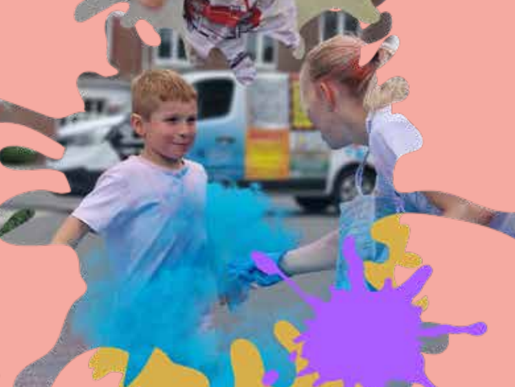
Kids Color Run