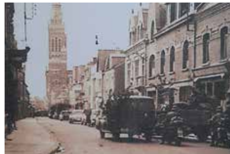
↳ Arrestation rue Birmingham, devant l'ancienne bibliothèque.

à l'ancien abattoir et à l'école Anatole France, avant d'être déportés ou envoyés à la prison d'Amiens.