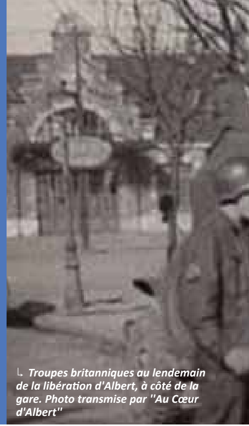
↳ Troupes britanniques au lendemain de la libération d'Albert, à côté de la gare.

Le 1 er septembre 2024, Albert célèbre le 80 ème anniversaire de sa Libération. Si Albert est connue pour avoir été durement touchée durant la Grande Guerre, elle fut également le terrain de la Seconde Guerre mondiale. Pendant plus de quatre ans, la ville fut occupée par l'ennemi Allemand, du 20 mai 1940 au 1 er septembre 1944.