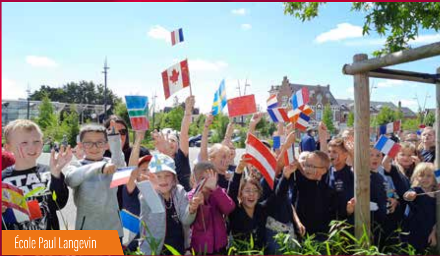
École Paul Langevin