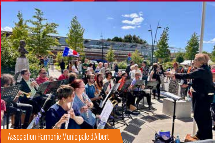
Association Harmonie Municipale d'Albert