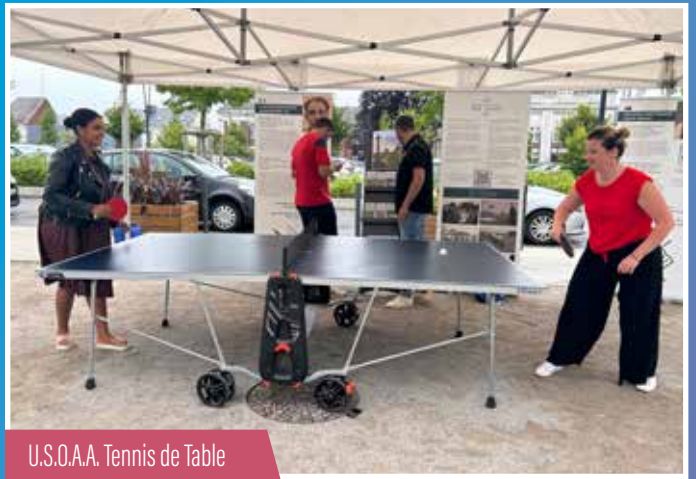
U.S.O.A.A. Tennis de Table