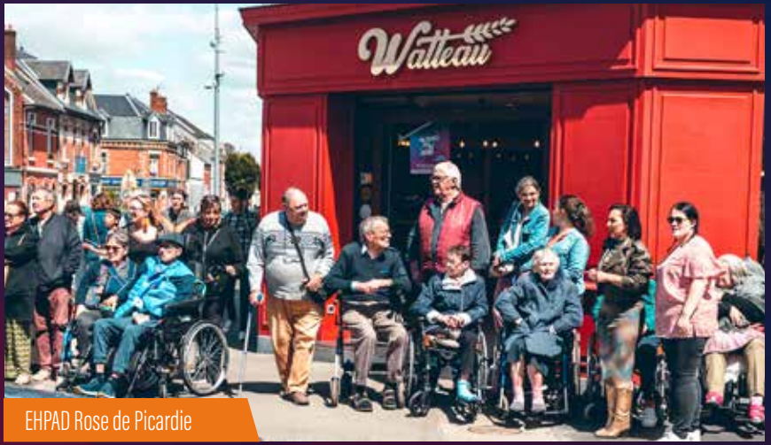
EHPAD Rose de Picardie