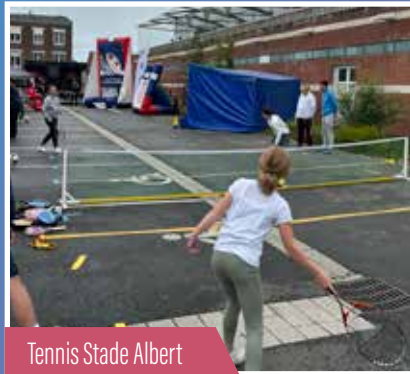
Tennis Stade Albert