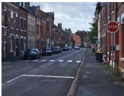
↳ Exemple d'aménagement : Stop intersection rues d'Aveluy / du Cadran

Des aménagements concrets ont vu le jour en réponse aux demandes des Albertins lors des réunions de quartier.