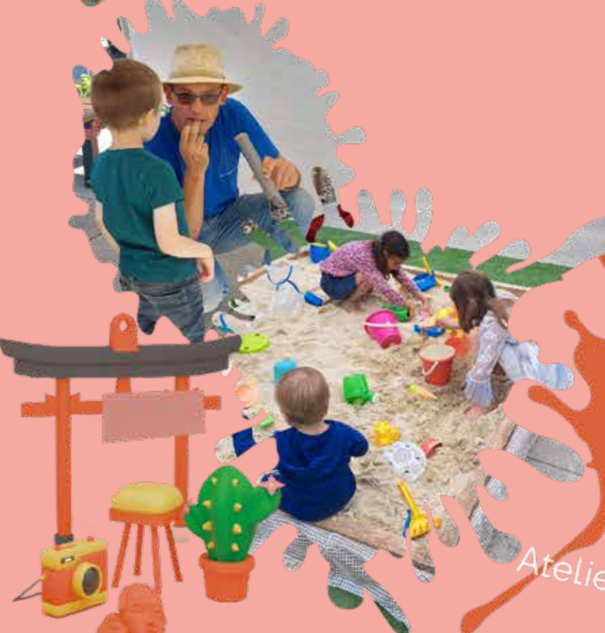
Atelier Bande Dessinée