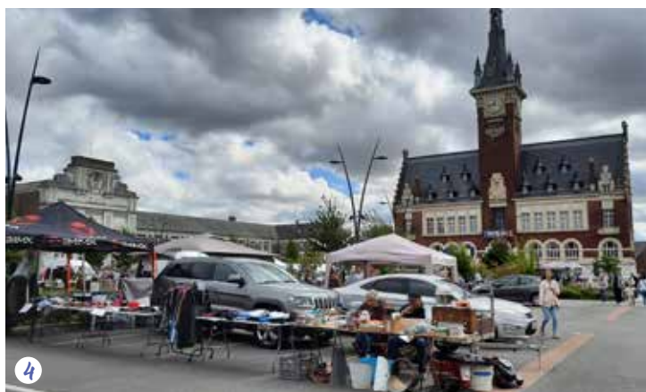
1. Albert'cyclette | 2. Braderie des commerçants, animation de rue "Les Nageuses" | 3. Fête d'Albert | 4. Réderie de la ville 5. Rencontre entre les élèves du collège Saint Charles de Foucauld et la ville jumelée allemande Niesky | 6. 1 er Salon du Flipper et des Jeux de bar | 7. Concert de l'Orchestre de Picardie | 8. Réception d'accueil des nouveaux Albertins | 9. Salon du Modélisme