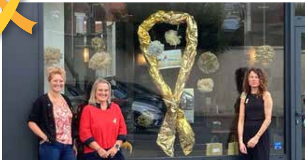
↳ Les commerçants participent à Septembre en Or en décorant leurs vitrines, ici le salon de coiffure "Le Petit Atelier".

En septembre, la mairie et les commerçants ont participé à ce mois de sensibilisation, en décorant leurs vitrines ou en organisant des évènements caritatifs. Le 9 novembre, la Biscuiterie du Coquelicot organisera une vente de crêpes au théâtre du Jeu de Paume lors de l'exposition Albert en Briques. Les profits seront reversés à l'association "Grandir sans cancer 80".